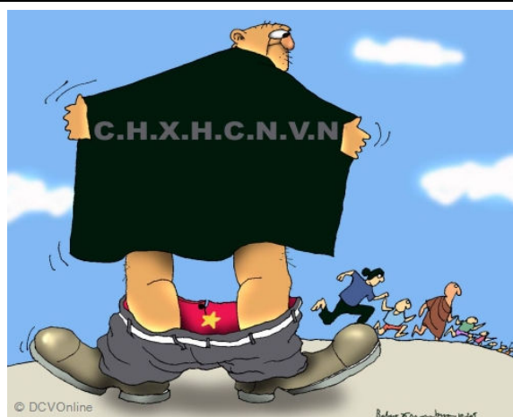
(Babui - DCVOnline)