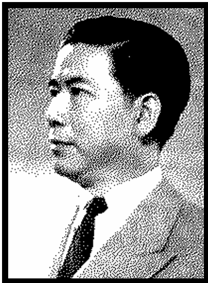
"Tôi tiên, hãy theo tôi ! Tôi lui, hãy bắt tôi !" (Cố Tổng Thống Ngô Đình Diệm †02-11-1963)