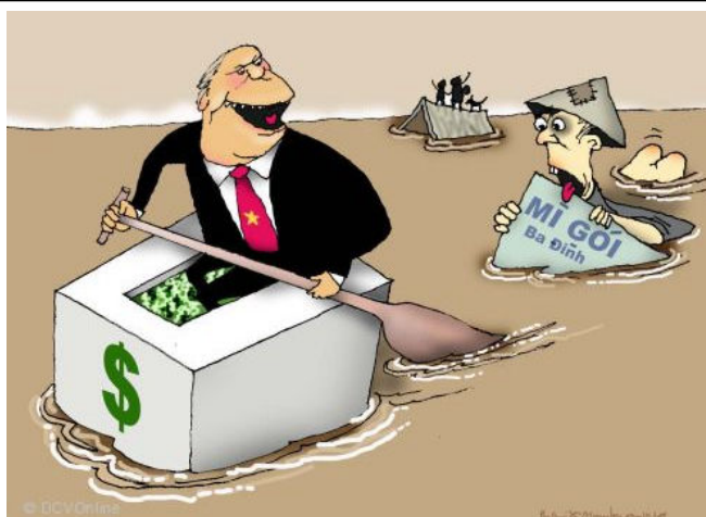
Cứu trợ (Babui - DCVOnline)

Coi những ai phản đối hai nhà cầm quyền Việt-Trung cách ôn hòa, bắt bạo động nói trên như thù địch khác giống nòi và gán ghép không ngần ngại những người ái quốc vào các tội vu vơ là "tuyên truyền chống Nhà nước" và "làm phương hại tình hữu nghị Trung Việt" để giáng lên đầu họ những hình phạt nặng nề. Song song đó lại trương lên câu "Nhiệt liệt chào mừng kỷ niệm 60 năm Quốc khánh nước Cộng hòa Nhân dân Trung Hoa" ở ngay thủ đô Hà Nội lẫn nhiều thành phố lớn khác hôm 01-10 mới đây, rồi ra lệnh cho báo chí và ngay cả website của đại sứ quán mình tại Bắc Kinh hết lời ca ngợi sức mạnh quân sự của Trung cộng, trong khi chính cái sức mạnh đó đang uy hiếp sự toàn vẹn lãnh thổ Việt Nam. Tất cả những vụ việc trên cho thấy tập đoàn lãnh đạo Việt cộng chỉ là một lũ Việt gian đúng nghĩa. Cái bản chất "vô tổ quốc", "phò đại đảng" chảy trong máu từ ngày chúng thắm nhiễm chủ nghĩa Cộng sản nay càng lúc càng bộc lộ rõ rệt. Loài phản dân hại nước đó có đáng nắm quyền tại Việt Nam nữa không? BAN BIÊN TẬP