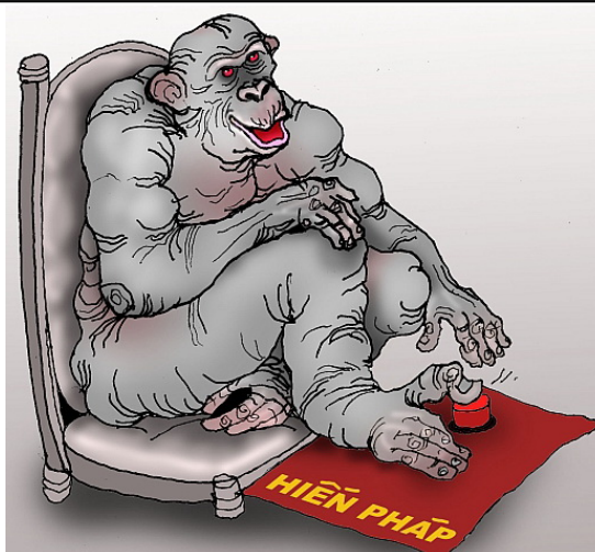
Hiến pháp bấm nút của Đảng (Babui - DCVonline)

Kết: Đại hài kịch vừa thấy khởi đầu cho đại bi kịch: Trước hết là bi kịch cho dân cho nước. Nguy cơ khủng hoảng kinh tế, đàn áp chính trị, lộng hành kiêu binh, nguy cơ cướp đoạt ruộng đất, đày đọa nông dân, bóc lột lao động, nguy cơ gia tăng tham nhũng, băng hoại đạo đức, suy đồi văn hóa, nói chung là nguy cơ chà đạp nhân quyền sẽ càng gia tăng sau cái “bản án treo cổ toàn dân” nghiệt ngã này. Thứ đến là bi kịch cho chính đảng CS. “Bản án” đó sẽ là giọt nước tràn ly phần nợ, là sức nén tận cùng lên chiếc “lò xo” để cơn hồng thủy và sức bật ngược của nhân dân sớm thanh toán cái chế độ và và cái chính đảng đã tự định nghĩa qua HP như một lực lượng chiếm đóng và như thế là kẻ thù và tội đồ muôn thủa của Dân tộc. Và sau cùng là bi kịch cho gần 500 tên mạo danh là dân biểu nhưng thực ra là đảng biểu (đảng biểu sao làm vậy). Để cho đảng tính tiêu diệt nhân tính, chứng thực sự là cận bã của nòi giống Việt và mang lấy ô nhục ngàn thu cho mình và cho con cháu. BBT