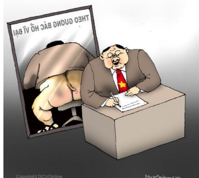
Phê và tự phê chơi

Tình hình chính trị VN đang hồi rối ren cực độ. Trên vũ đài chính trị, các đầu sớ đang tung ra hết những chiêu thức hạ đẳng nhất hòng hạ gục đối phương như: chụp mũ, vu khống, gắp lửa bỏ tay người, tạo tài liệu giả mạo đây về đối phương để lấy cớ triệt hạ lẫn nhau giống như bọn giang hồ tay sai chính trị ném ma tuý, hồ sơ giả mạo... vào nhà người khác sau đó ập vào khám xét lấy bằng cớ để kết tội.