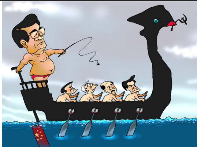
Con thuyền xã nghĩa (Babui-Danchimviet.info)