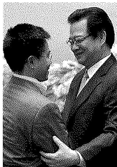
Giáo sư Ngô Bảo Châu và Thủ tướng CS Nguyễn Tấn Dũng