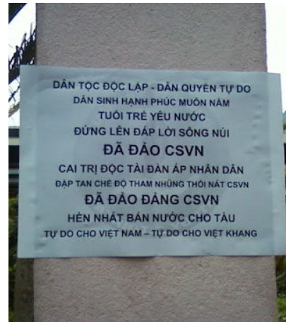
Truyền đơn của Tuổi trẻ Yêu Nước tại Hà Nội 10-02-2012