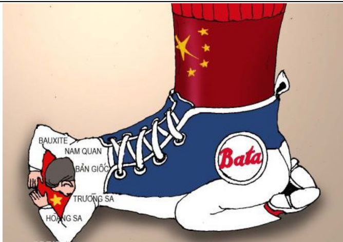
Bata Hùng Dũng Sang Trọng (Babui-DCVOnline)

Mười một cuộc biểu tình trong ba tháng qua, với những biểu ngữ hay khẩu hiệu thuần túy chống TQ xâm lược (ngoại trừ vài lời hô đơn lẻ "đả đảo bọn bán nước, bọn chó săn"... trên các xe buýt bắt người về đồn) cũng là những hình thức kiến nghị với nhà cầm quyền CSVN, xin họ hãy lưu ý tới đại họa Tàu cộng. Như đã thấy, đáp lại trực tiếp là những màn hăm dọa hay ngăn cản, bắt nống hay bắt nguội, đuổi học hay đuổi việc, đánh người hay đập mặt, giữ ít giờ hay giữ ít ngày, và gián tiếp là nhiều vụ giam cầm và xét xử... Tất cả các sự kiện ấy đều đã chẳng cho thấy "thiện chí đối thoại" của nhà cầm quyền sao? Hơn 70 năm CS Âu và hơn 60 năm CS Á sao chưa mở mắt những người còn mong chờ "tinh thần phục thiện" của đảng? BBT